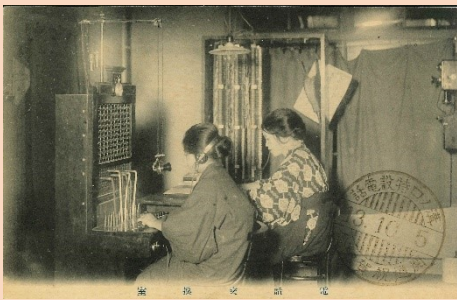
電話交換手（溝ノ口郵便局2階）

講師は、日本近現代政治史、文化史がご専門で、川崎市市民ミュージアムで歴史・民俗担当学芸員として、ご活躍中の霜村光寿氏をお招きします。