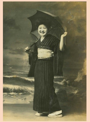
洋傘を持つ女性 （料亭やよい所蔵）