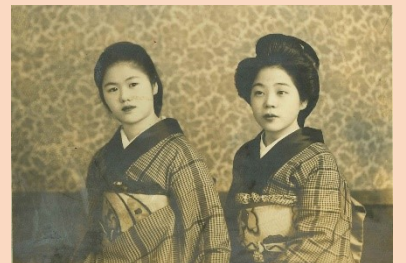
西洋風の髪型の女性と日本髪の女性 （料亭やよい所蔵）