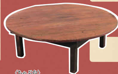
〈ちゃぶ台〉 川崎市市民ミュージアム所蔵