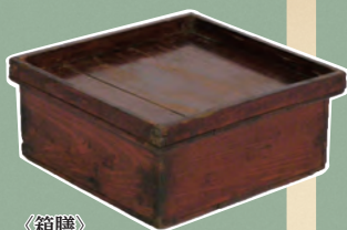
〈箱膳〉 川崎市市民ミュージアム所蔵