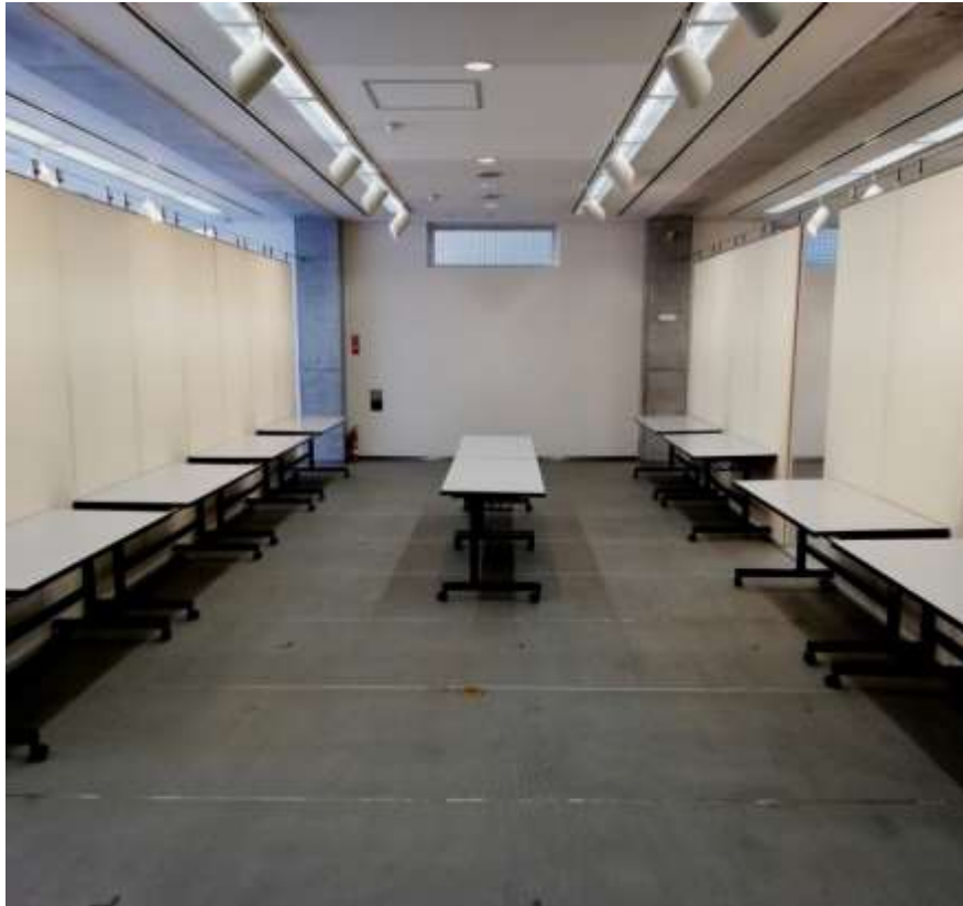
展示会場(川崎市大山街道ふるさと館イベントホール)のようす