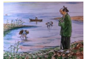
（海を見つめる池上幸豊） 副読本 かわさきより