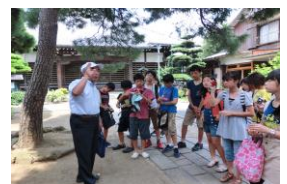
〈大山街道史跡見学〉