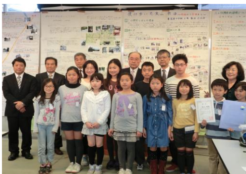
〈講師の先生や来賓の方々〉

3月13日（水）、24年度の活動を締めくくる研究発表会が行われました。大勢の参会者のもと温かい雰囲気の中で行われました。探検クラブ員15人が発表しました。