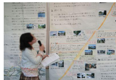
〈クラブ員による研究発表〉

子どもたちは夏休み中に頑張って作成した模造紙の作品、1年間の活動を通して発見したことや体験してできるようになったことなどを自分の言葉で堂々と発表していました。発表後に講師の先生や来賓の方々から称賛や励ましの言葉をいただきました。そして会の終わりに細田館長から賞状と記念品を手渡され満足そうな笑顔