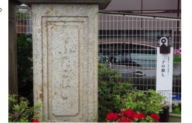
▲現在の「二子の渡し」跡

9厘、馬とそれを引く人が9厘でした。(※当時米一表、60 キ が2円、1円の1/1000が1厘)江戸時代でも水量の少ない冬季には架橋にして渡りました。大正14年に近代的な二子橋が完成しこれにより渡しの役目も終わることとなりました。