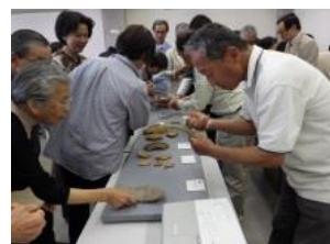
▲石器を手にする参加者

講座後、参加者の方々から「他県からの転入なので川崎には馴染みがうすかったのですが、講座に参加してこの地域に親しみが強まりました。また参加します。」とか「ぜひ講座の続きを」という声が寄せられました。