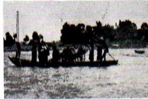
荷車をつんで渡る渡し船(大正時代)

街道の渡しであります。始まりの記録ははっきりしていません。『川崎市史』によりますと二子の渡しは元禄年間からあったと記述されています。江戸時代の中期、後期には大山参りの参詣客や江戸からの物見遊山の客で賑わい、渡し場の権利争いは(元禄年間には上丸子のものが所有し、その後は両岸の村持ち)大正期まで絶えませんでした。明治9年(1876)1月、当時の渡し賃は一人で渡る場合は3厘、荷車とそれを引く人で