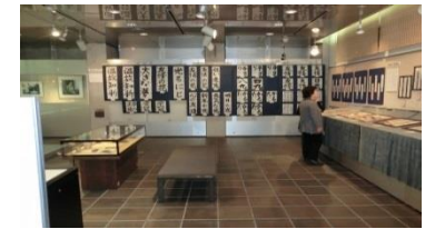
▲第2回企画展会場（昨年度）