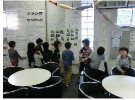
▲昨年度の作品の前で

一回目の活動では、今年の探検クラブの活動内容と自分のめあてについて話し合いました。その後グループに分かれて館内を見学し、展示室では説明する職員の話に熱心に耳を傾けていました。