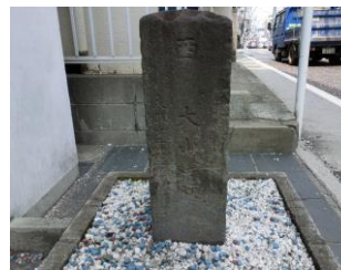
▲ふるさと館前の道標