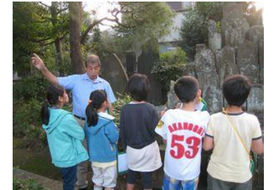
地域の史跡を興味深く見学

10月の探検クラブは、二子方面の探検でした。「二子神社」や「岡本かの子文学碑」など街道沿いにある名所や寺院の話を伺いました。火事になっても燃えにくい「蔵造り」の田中屋呉服店や「光明寺」は明治になって、全国に初めて学校ができた時に、本堂がそれに当てられ「二子学舎」と言われたことなども教わりました。