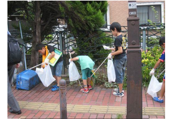
汗を流してがんばる子ども達