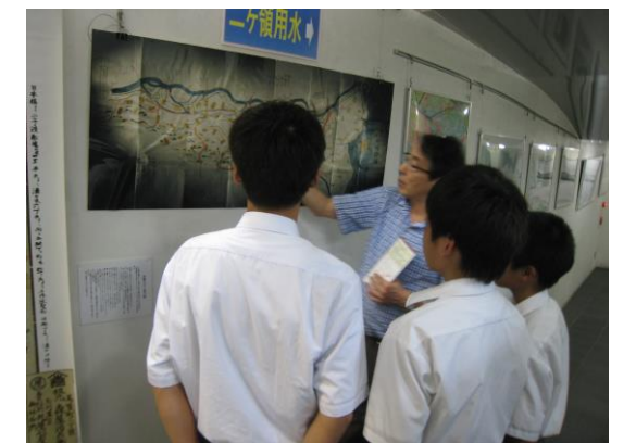
当館で職業体験学習をする中学生

最後に生徒達から「ふるさと館には、初めて来ました。円筒分水や大山街道のことを詳しく知ることが出来てとても良かったです。」と感想を述べてくれました。