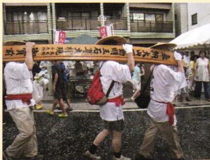
▲納め太刀を担ぐ町内の方々

本部席を前にして繰り広げられるパフォーマンスに大勢の観客から拍手喝さいが送られ、祭りは最高潮を迎えました。街道狭しとパレードが続き、真夏の祭典は一日中大勢の人で賑わいました。