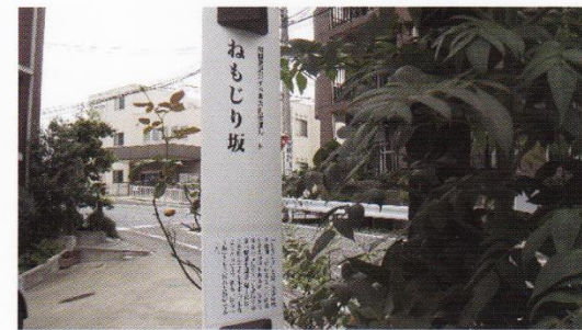
▲旧大山街道ねもじり坂

下肥を運ぶ時に後押しをつけないと坂を上ることができないくらいに急な坂道でした。坂があまりにも急で、腹が減るので「腹へり坂」とも呼ばれていました。この坂道を上っていくと、所どころに昔の面影を残す建物や風情に出会うことができます。