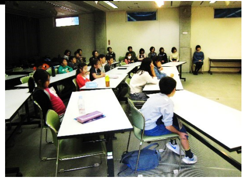
▲話に聴き入る子ども達