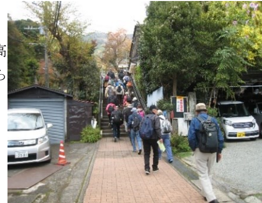
▲街道学習の様子(1回目)

※3日間とも晴天に恵まれ、最後目的地大山阿夫利神社到着にふさわしい錦秋の中での街道歩きでした。現地にて閉講式を行いました。参加者の中から「今後もこの講座を続けて欲しい。」という声がありました。参加者一人一人のご理解とご協力のたまものです。7年前から実施してきたこの街道学習講座を怪我や事故もなく無事に終了することができ、講師の中平氏には、多大なご尽力をいただきました。ありがとうございました。