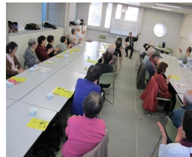
▲新富ご主人の三味線演奏

今回は体操・食事の後に三味線演奏を楽しむ会が催され、参加者は目の前で演奏される三味線に聞き入っていました。次回は来年の2月8日(木)午前10時からふるさと館3階で実施する予定です。