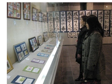
▲昨年度のカルチャー展