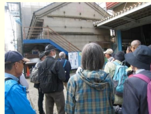
▲飯島金物店、左奥に大釜が見える