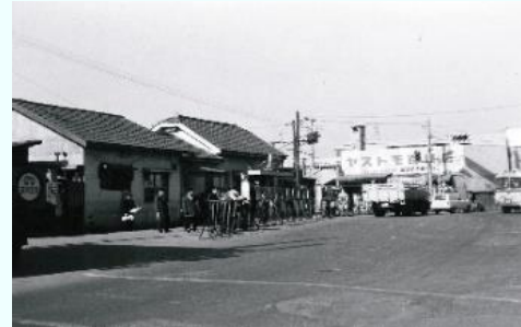
▲武蔵溝ノ口駅北口(昭和41年頃)