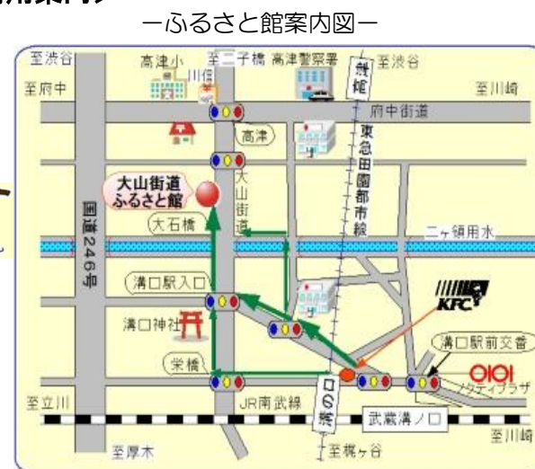
JR南武線 武蔵溝ノ口駅 下車 徒歩7分 東急田園都市線 高津駅 下車 徒歩5分

※ふるさと館では、イベントホール(定員64名)、第1会議室(12名)、第2会議室(30名)、和室(10名)が利用できます。「ふれあいネット」からお申込みください。団体登録・個人登録ともに申し込みができます。