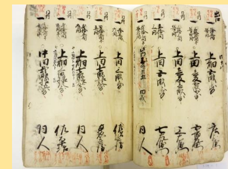
上田文書 溝口村検地帳 写 (宝永4年)

6月22日(土)～8月29日(木) 10時から17時 会場 ふるさと館 展示室 【入場無料】