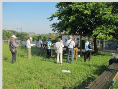
橘樹官衙遺跡群(たちばな古代の丘緑地)

次回は11月9日(土) 久本・新作を歩きます。 みなさまのご参加をお待ちしております。