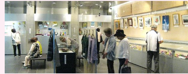
▲今年の展示の様子

6月14日(金)～17日(月)の4日間にわたり、ふれあいクラブ高津(高津区老人クラブ連合会)の皆様が作品(絵画、書、陶器、手芸など)169点を展示室等の会場いっぱいに展示し、大勢の来場者でにぎわいました。今年も会員の皆さんが1年間、丹精込めて創り上げた作品だけに、いずれも来場者を感動させる素晴らしい作品展となりました。