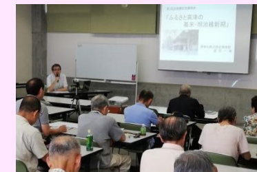
▲企画展記念講演会