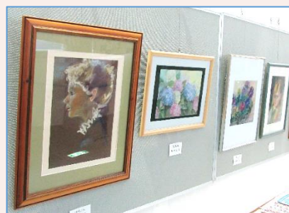
▲高津パステルの会