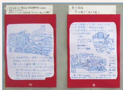
▲万年筆で描いた散歩絵