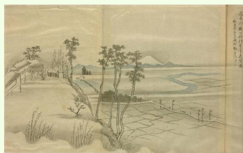
▲行善寺遠望図