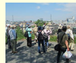
▲前の子母口まち歩き