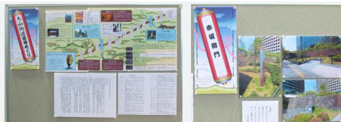
▲第1回「赤坂御門」の展示

11月1日(金)より、1階下スロープにてミニ企画展「大山街道の宿場めぐり」第2回を展示します。前回の「赤坂御門」に引き続き、今回は「渋谷・三軒茶屋」の大山街道をパネルで解説いたします。