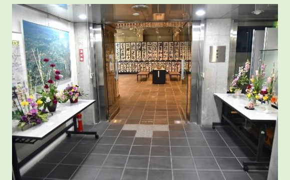
昨年度の展示風景

開催期間：2021年2月27日(土)～ 2021年3月4日(木) 場所：1階展示室 開室時間：10:00～17:00 入場料：無料