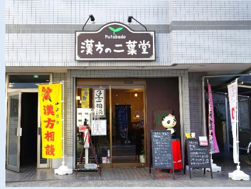
「漢方の二葉堂」店舗外観

日時：2021年1月12日(火) 10:00～11:30 場所：2階イベントホール 参加費：500円 現在受付中 申込方法：電話・FAX・窓口にて