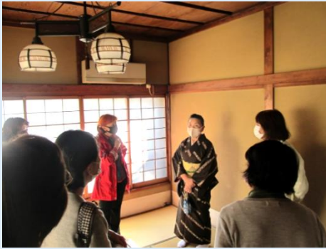
「やよい」の2階で女将さんからの説明を聞く

「やよい」では二班に分かれ交代で、先代の女将さんのインタビュー動画を観たり、歴史を感じられる料亭の建物内部を女将さんの説明を受けながら見学したりしました。来年度は、例年のようにお茶とお菓子をいただけるとよいと思う訪問でした。